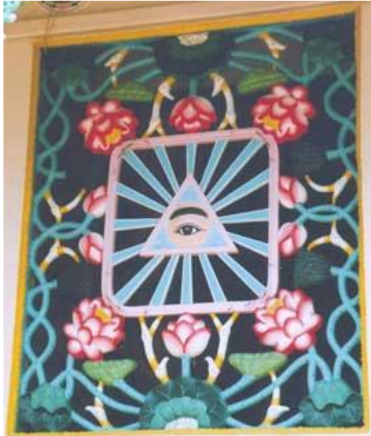
Hình Thiên Nhãn và bông sen chung quanh Đèn Thánh

- Thiên Nhãn là ngôi Thái Cực tức là Trời. Nhãn là chủ của Tâm nên Tâm ta động thì Trời đã biết. Tâm ta tưởng Trời tức có Trời trước mặt dầu ở phương nào cũng vậy. Ấy là Phật tức Tâm - Tâm tức Phật. Đức Chúa cũng chỉ Tâm làm nguồn cội của con người vậy.