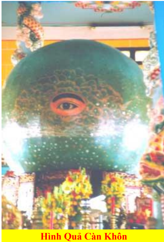
Hình Quả Càn Khôn

- Bát Quái Đài là Bát Cảnh Cung, nơi thờ các Đấng Thiêng Liêng.