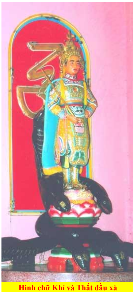
Hình chữ Khí và Thất đầu xà