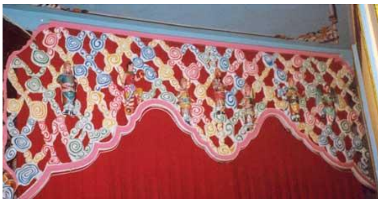
Hình khuôn dìm bên hữu

- Khi cất Đền Thánh xong, Đức Hộ Pháp không hiểu nên để Thất Hiền hay Thất Thánh nên Đức ngài cầu Đức Lý Đại Tiên giáng cơ chỉ giáo Đức Lý Ngài nói rằng: