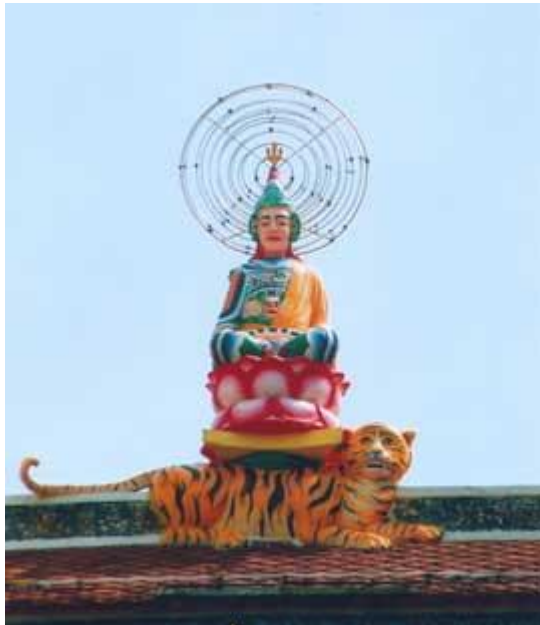
Hình Đức Di lạc cỡi cọp

- Đức Di Lạc là một vị phật cảm quyền làm chủ Hội Long Hoa lần thứ ba, Ngài ngồi trên nóc Hiệp Thiên Đài để vâng lệnh dạy của Chí Tôn và quan sát chấm công điểm Đạo được đem vào Bạch Ngọc Kinh mà dự hội.