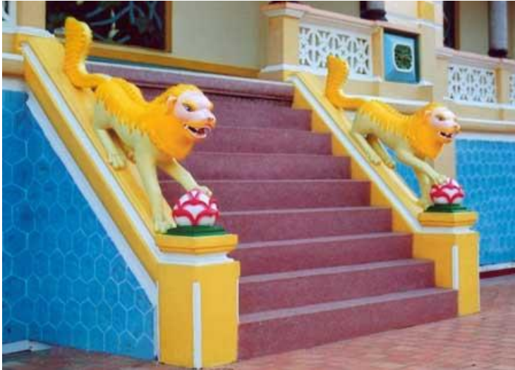
Hình kim mao hầu

- Bốn cửa hai bên Đền Thánh mỗi cửa có hai con Mao Hầu. Tượng trưng y như Bạch Ngọc Kinh, có những con Kim Mao Hầu đón rước các chơn linh có công cùng Đạo đặng đưa lên Bát Quái Đài.