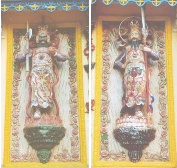
Hình Ông Ác