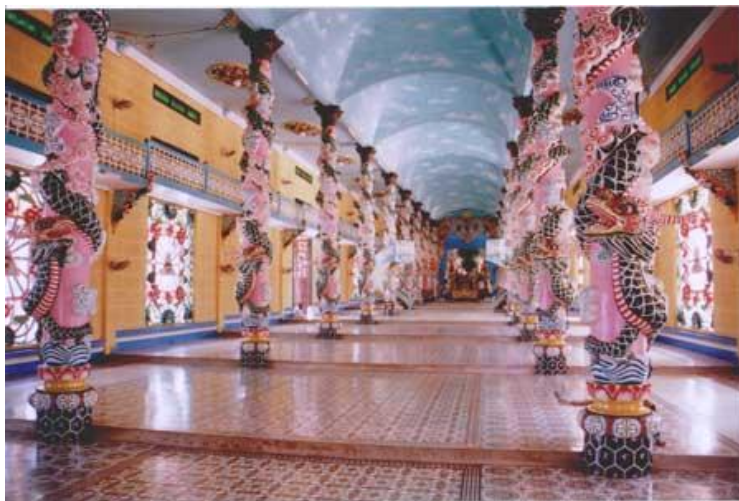
Hình cột rồng

- 28 cây cột Rồng trong Đền Thánh là thay thế cho Nhị Thập Bát Tú, - tức là: Thần, Thánh, Tiên, Phật - vậy. Vì nơi Bạch Ngọc Kinh thì Đức Chí Tôn ngự có Thần, Thánh châu. Hôm nay đền thờ Đức Chí Tôn thay thế cho Thần Thánh bằng Rồng châu Chí Tôn. Và có nhiều màu sắc tức là có 3 thời kỳ lập Giáo thì có 3 Hội: