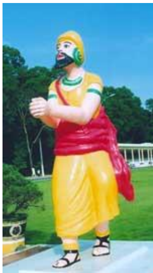
Hình Sa Nặc

- Đức Phật Tô cõi ngựa trước Đền Thánh và người chạy theo sau là vị tổ trung thành tên Sa Nặc. Ngài lúc ở thế là một vị thái tử con vua Tịnh Phạn Vương, mẹ là hoàng Hậu Na Da ở nước Ca Tì La Vệ. Ngài tên Thích Ca. Trong khi Ngài trưởng thành, Ngài rất thông minh, học một biết mười, tánh tình thuần hậu nên được vua cha yêu mến. Đến năm mười sáu tuổi, ngài có gia thất. Vợ ngài là công chúa Gia Du Đà La, sau sanh một đứa con trai tên là La Hầu La. Ngài đang sống trong cảnh nhà vàng cửa ngọc, vợ đẹp hầu xinh. Bỗng một hôm ra khỏi hoàng cung đi dạo ngoài bốn cửa thành, ngài đi đến Bắc Môn thấy người cày ruộng với đôi trâu coi mệt nhọc dưới ánh nắng chang chang như thiêu đốt, thật sanh ra là khổ. Ngài liền qua phía Đông Môn gặp ông già chống gậy đi bước thấp bước cao, ôi già là khổ. Trở qua phía Nam Môn gặp một người bệnh đang nằm dưới đất rên xiết ôi bệnh cũng khổ. Ngài trở lại Tây Môn thấy một người chết nằm dựa bên lề đường, ruồi lặn bu bám. Ôi! chết cũng khổ! Ngài liền trở về hoàng cung nằm suy nghĩ thật