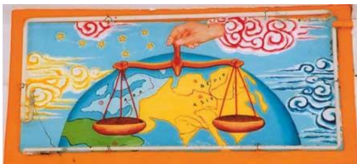
Hình cây cân công bình

- Con người sanh trên mặt thế nhất nhất vật gì cũng hữu hình, tức hữu hoại, đều là giả tạm, chỉ linh hồn là thiệt tướng, bất tiêu bất diệt, khi hồn lìa khỏi xác chỉ đem theo cái tội và phước. Dầu chủng tộc nào cũng đồng chung một luật của tạo hoá, thì chính bàn tay thiêng của tạo hoá mới cầm cây cân công bình đặng, chớ nơi mặt thế này mắt thấy tai nghe thì không khi nào cầm cây cân đúng lý nơi tạo hoá đặng.