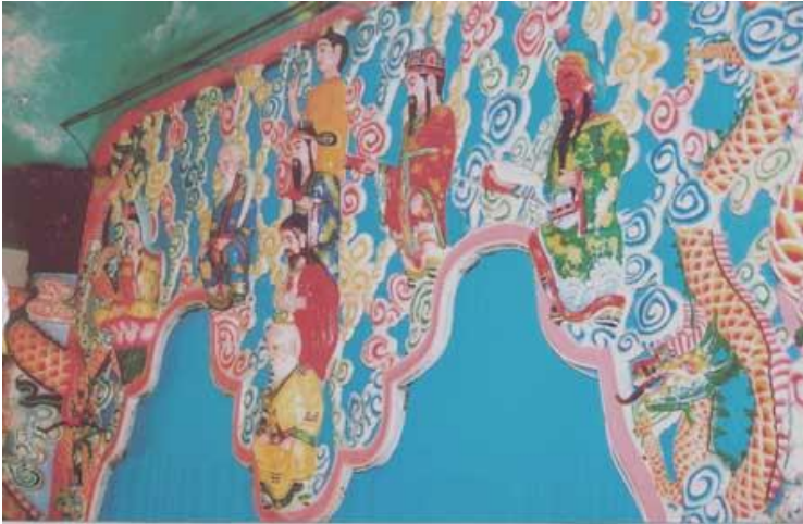
Hình khuôn đìem ngay chính giữa Cung Đạo

- Trên tấm khuôn đìem trước mặt tiền là Ngũ Chi Đại Đạo, Tam Giáo và Tam Trấn.