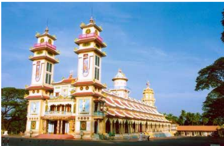
Hình Tòa Thánh