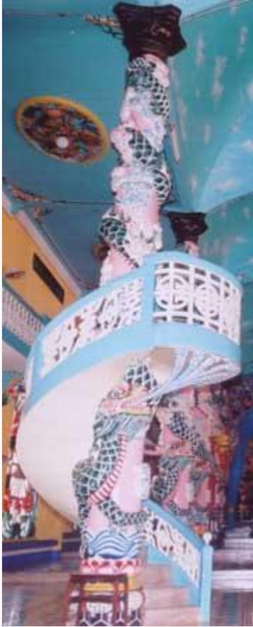
Hình rồng nơi đài thuyết đạo

- Hai cái Đài Thuyết Đạo đây có nghĩa là tích Vua Phò Dư lập đài tổ cáo trời đất. Khi Đức Khổng Tử đi truyền Giáo (Đạo Nho) qua nước Phò Dư gặp phải ông vua tánh tình tàn bạo, không ưa Tôn Giáo, không thích tu hành. Vua ra lệnh bắt Đức Khổng Tử giam vào ngục thất ngoài hai năm mới phóng xá và cấm trong nước nếu ai theo đạo của Ngài thì tru di. Vua lại ra 6 điều: