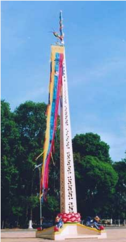
Cột phước trước Đền Thánh

- Lá phước chiều dài 9 thước, bề ngang 1 thước 2 tấc, dưới thì nền vàng, trên mặt có 3 màu: vàng, xanh, đỏ. Đoạn trên có Thiên Nhân kế đó Cổ Pháp Hiệp Thiên Đài rồi kế là sáu chữ Đại Đạo Tam Kỳ Phổ Độ. Ngay chính giữa lá Phước là giỏ hoa Lam, kế đến có 9 thẻ, hai bên bia là 12 thẻ theo chiều dài.