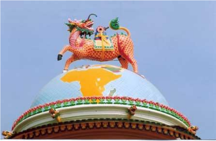
Hình Long Mã

- Tích đời vua Phục Hi (đời Ngũ Đế ) nơi sông Mạnh Tân có nổi lên một con quái vật mình ngựa, đầu rồng, làm cho nước dâng lên và sóng gió. Khi vua Phục Hi ra xem và nói rằng: Nếu nhà ngươi đem báo vật cho ta thì vào, con Lân Mã từ từ lên qui xuống mà dâng Ấn Kiếm và Bát Quái Hà Đồ cho Ngài làm vua trị thế. Ngài lấy Bát Quái Hà Đồ phân định phương hướng, toán định mà lập Đạo dạy dân ấy là Đạo phát khai tại cõi Đông trước hết, lần lần truyền qua cõi Tây.