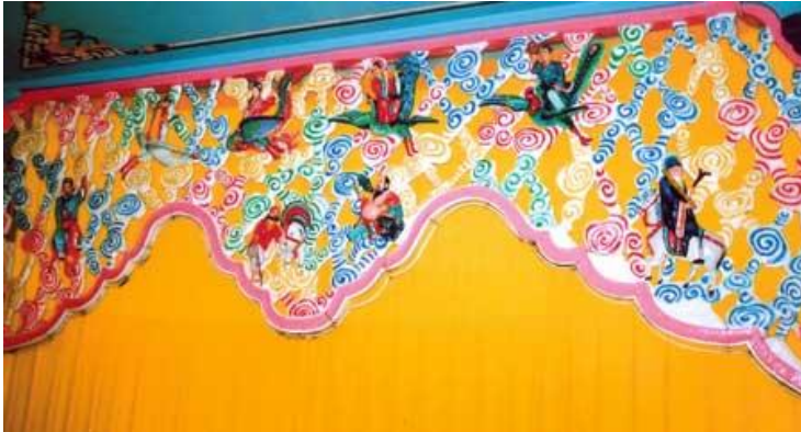
Hình khuôn diềm bên tả