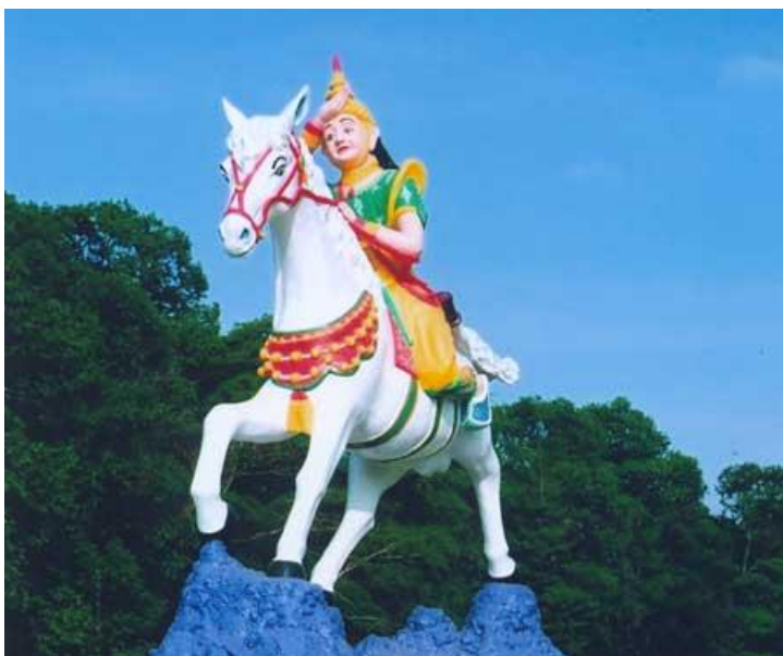
Hình Phật Tổ cỡi ngựa trước Đền Thánh