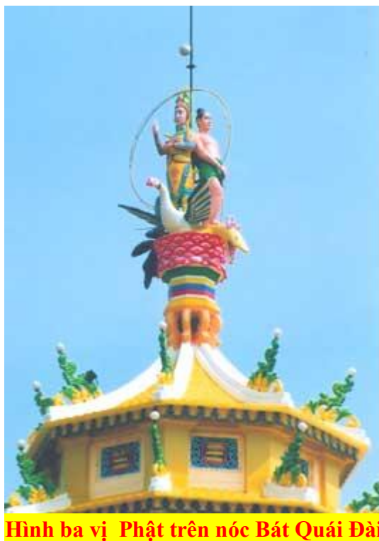
Hình ba vị Phật trên nóc Bát Quái Đài