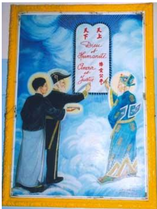
Hình Tam Thánh Ký Hòa Ước

- Tạo sao trước đền thờ ĐỨC CHÍ-TÔN lại có tượng ba bậc vĩ-nhân của ba nước Việt- Pháp- Hoa là NGUYỄN-BÌNH-KHIÊM, VICTOR-HUGO và TÔN-VĂN mà chúng ta tôn là Tam Thánh.